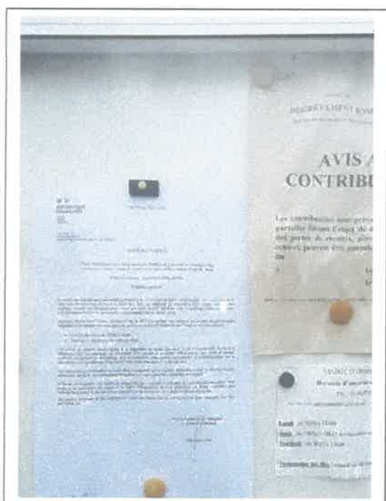
Affichage dans le tableau de la Mairie

Le commissaire enquêteur a constaté la mise en place des affichages.