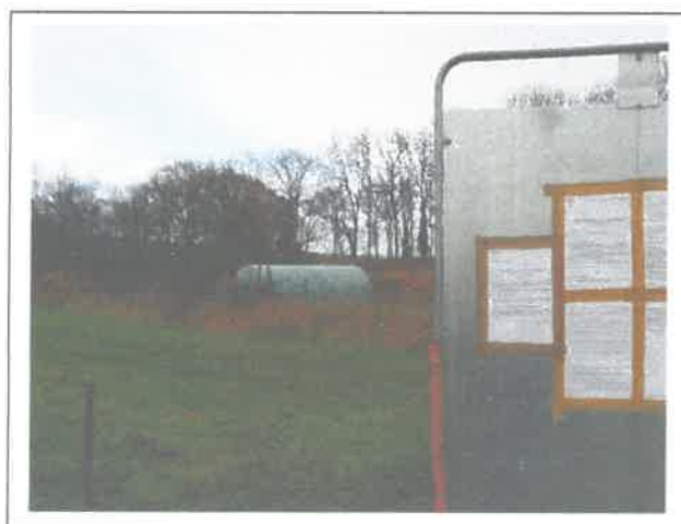
Affichage de l'enquête publique sur site